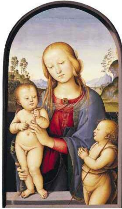
پیترو پیرجینو Petro Perugino